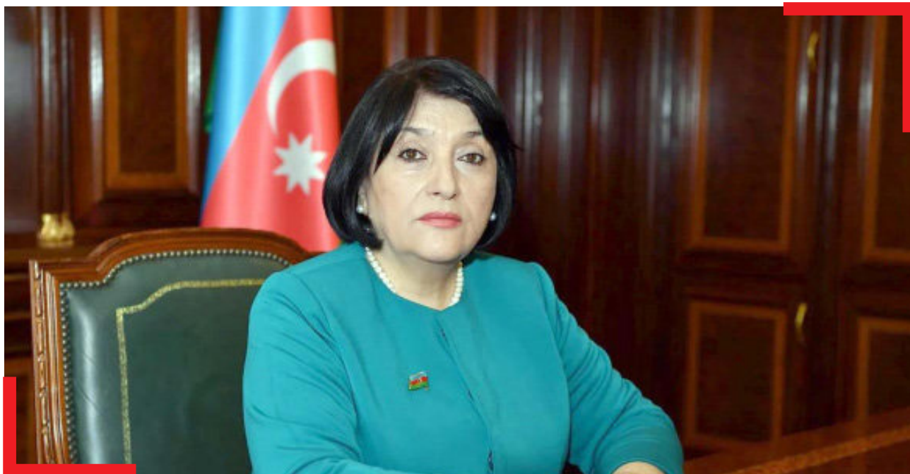
S.E. Mme. Sahiba Gafarova, Présidente de l'Assemblée Nationale d'Azerbaïdjan, à l'UPCI :