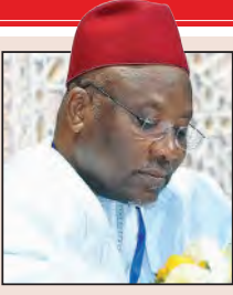
بقلم | محمد قريشي نياس - الأمين العام للاتحاد