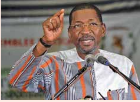
السيد الحسن ساكندي رئيس المؤتمر الـ ١٥ للاتحاد