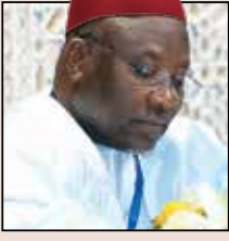
بقلم | محمد قريشي نياس - الأمين العام للاتحاد